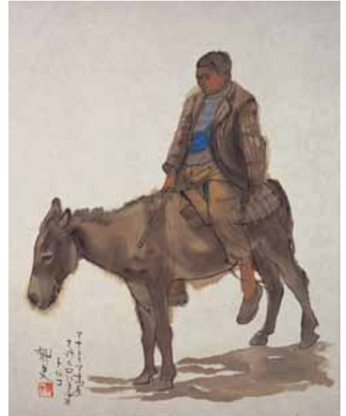
Katır Üstünde Çocuk: Kapadokya, Anadolu Platosu, Türkiye A Boy on a Mule: Cappadocia, Anatolia Plateau, Turkey, 2009

Michiko Hirayama Hirayama Ikuo İpek Yolu Müzesi Vakfı Başkanı