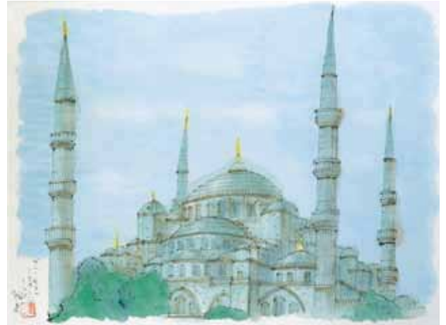
Sultanahmet Camii, İstanbul, Türkiye Blue Mosque, İstanbul, Turkey, 2008

Hirayama was appointed as Japan's first Goodwill Ambassador to UNESCO in 1988 and Special Advisor to the UNESCO World Cultural Heritage in 1995. He emphasized the cultural exchange with his visits and research to the Middle East as well as his art focusing on the ancient ruins. The artist who passed away in 2009, is now visiting Turkey-the meeting point of West and East in his own words, with his paintings.