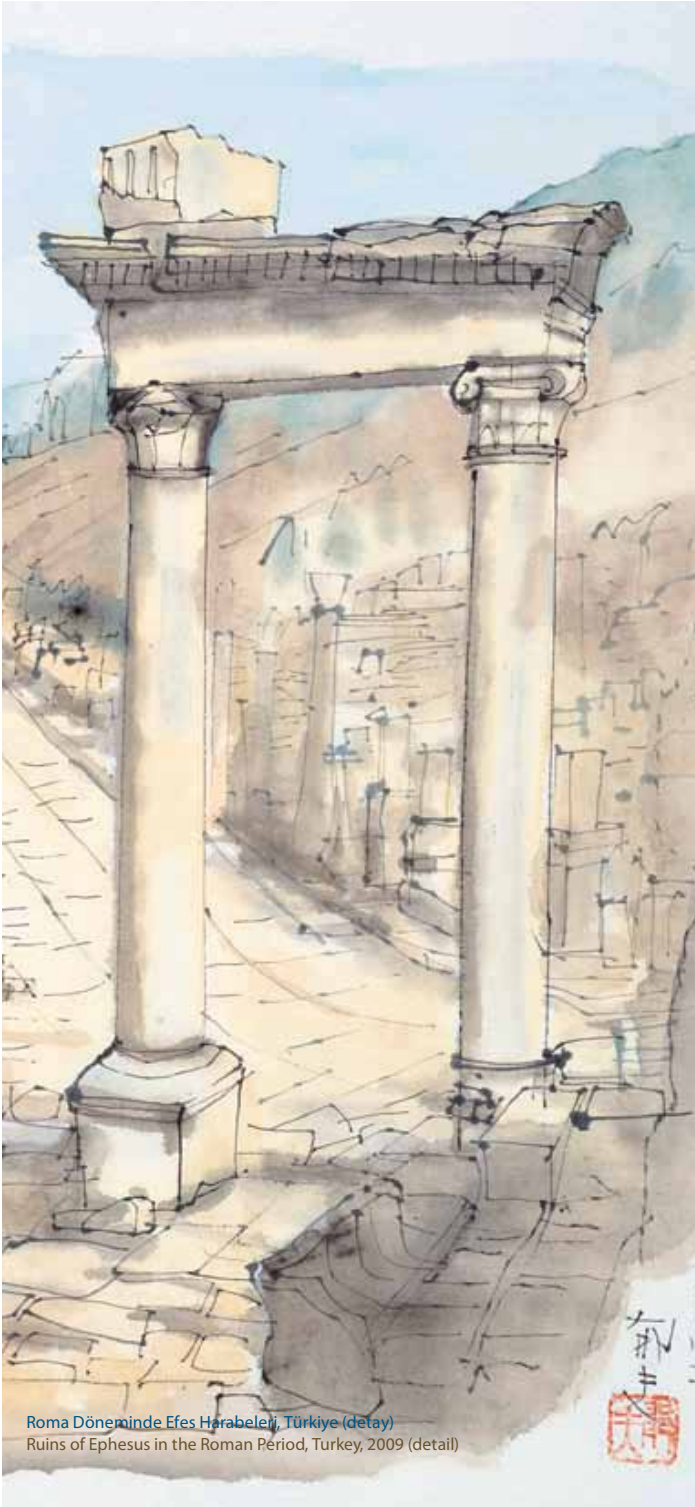
Roma Döneminde Efes Harabeleri, Türkiye (detail) Ruins of Ephesus in the Roman Period, Turkey, 2009 (detail)

"Tokyo Güzel Sanatlar Okulu'nda öğretim görevlisi olan eşim Ikuo Hirayama, 1996 yılında Kapadokya bölgesini incelemek için oluşturulan Ortaçağ Oryantal Eser Araştırma Heyeti'ne katıldı. Bu sırada Ihlara Vadisi'nde yer alan Hıristiyan kilise ve manastırlarındaki pek çok duvar resmini kopyalama olanağına sahip oldu. 1973'te bir grup arkeologla Büyük İskender'in antik çağdaki güzergâhının tersi yönde Afganistan'dan İran'a, Suriye ve Türkiye'ye yolculuk etti ve sayısız eskizle döndü. Japonya Vakfı, 1976 yılında, İran, Irak, Suriye, Mısır ve Türkiye'de Japon kültürünün tanıtımı için sergiler açmasını istedi. Ahşap kutular içinde 60 panelden oluşan büyük resimlerle çıktıkları bu yolculuk olağanüstüydü. Son sergi, "Ikuo Hirayama: Japon Resmi" İstanbul'daki Devlet Güzel Sanatlar Akademisi'nde gerçekleşti.