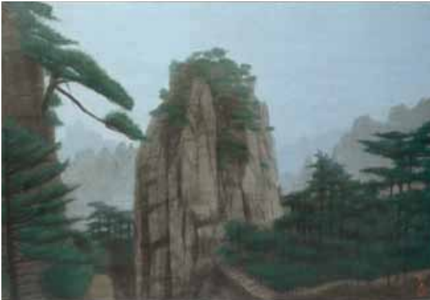
Yağmurda Kutsal Huangshan Dağı, Çin The Sacred Mt. Huangshan in the Rain, China, 2006

Michiko Hirayama President of The Hirayama Ikuo Silk Road Museum Foundation