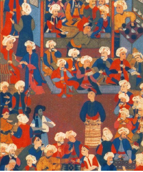
Jean Baptiste Vanmour, 1725? Tuval üzerine yağlıboya, 90 x 121 cm

Sergi alanında yer alan İstanbul'da Bir Kahvehane başlıklı minyatürün animasyonu konuya giriş için oldukça yararlı ve eğlenceli bir anlatım sunuyor. Videoda gördüğünüz hikâyeler hakkında öğrencilerle sohbet edebilir bunun için aşağıdaki sorulardan faydalanabilirsiniz.