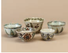
Fincanlar 18. yüzyıl