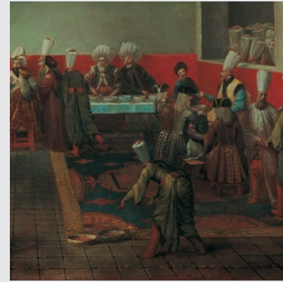
Elçi Onuruna Sarayda Verilen Yemek Jean-Baptiste Vanmour Tuval üstüne yağlıboya, 90 x 121 cm. (1725 ?)

Wikimedia Topluluğu Kullanıcı Grubu Türkiye'nin, Türkiye'deki ilk GLAM ve VikiKarekod projesi olan #VikiPera projesi, WMTR'nin galeriler, kütüphaneler, arşiv ve müzeler ile yürüttüğü GLAM-WIKI projeleri kapsamında yer alıyor.