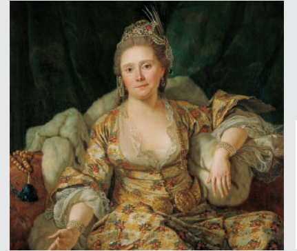
Vergennes Kontesi'nin Türk Giysileri İçinde Portresi Antoine de Favray Tuval üstüne yağlıboya, 129 x 96 cm. (1766)