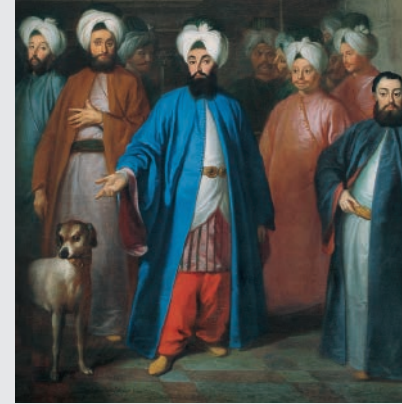
Mehmed Said Efendi ve Maiyeti George Engelhardt Schröder Tuval üstüne yağlıboya, 112 x 141,5 cm. (1733 ?)