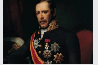
Fransa'nın İstanbul Büyükelçisi Antoine Edouard Thouvenel'in Portresi Adolph Diedrich Kindermann Tuval üstüne yağlıboya, 99 x 79,5 cm. (1854)