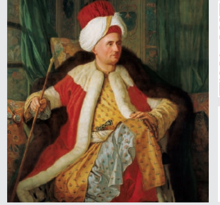
Fransız Büyükelçisi Vergennes Kontu Charles Gravier'nin Türk Giysileri İçinde Portresi Antoine de Favray Tuval üstüne yağlıboya, 141,5 x 113 cm. (1766)